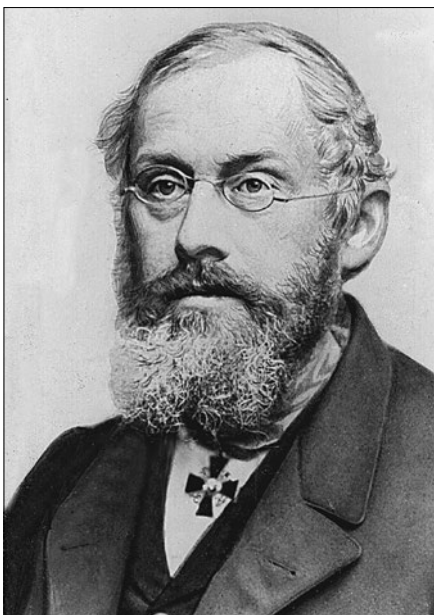
Jan Arnošt Smoler

Jan Arnošt Smoler narodži so 3. měrca 1816 jako syn wučerja we Łuču/Merzdorf; wjes je so 1978/79 wuhla dla zhubila. Wón wotrosće we Łazu, wopyta gymnazij w Budyšinje a studowaše teologiju a słowjansku filologiju