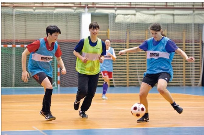
Žony sportoweje jednotki Chrósćicy při treningu.

Za wobdźelnikow a wuhotowarjow je EUROPEADA wjace hač sportowy wjeršk. W jeje srjedzišću steja, tak pisa FUEN, měrliwe a tolerantne zhromadne žiwjenje, mnohota a zachowanje kulturneho a rěčneho namrěwstwa Europy kaž tež zetkanja ludźi. Přenja EUROPEADA wotmě so 2008 w kantonje Graubündenje w Šwicarskej, druha 2012 we Łužicy.