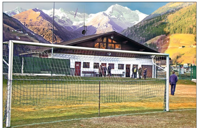
Lětuša EUROPEADA wotměje so před krasnej kulisu juhotirolskich horin.